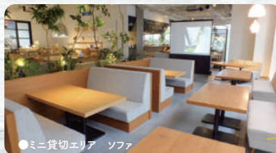
●ミニ貸切エリア ソファ