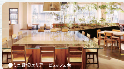
●ミニ貸切エリア ビュッフェ台