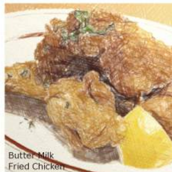
Butter Milk Fried Chicken