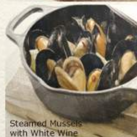
Steamed Mussels with White Wine

Stewing Pasta or Rice with The Leftover Soup of Steamed Mussels +¥500 ムール貝の白ワイン蒸しの残ったスープをパスタ or おじや に!!