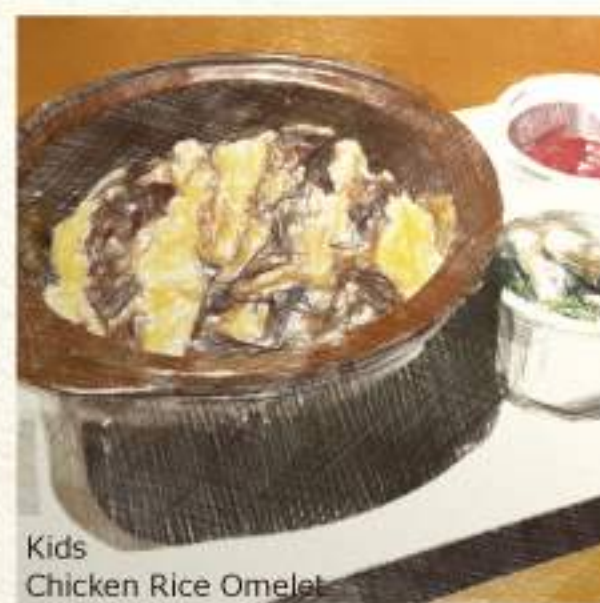
Kids Chicken Rice Omelet