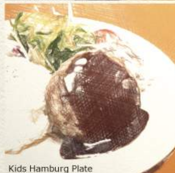
Kids Hamburg Plate