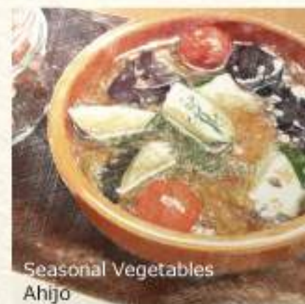
Seasonal Vegetables Ahijo

Steamed Mussels with White Wine ..... ¥780 ムール貝の白ワイン蒸し