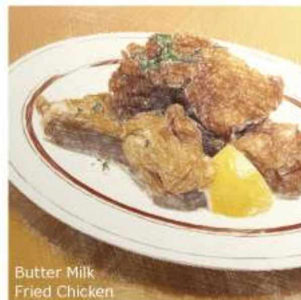
Butter Milk Fried Chicken