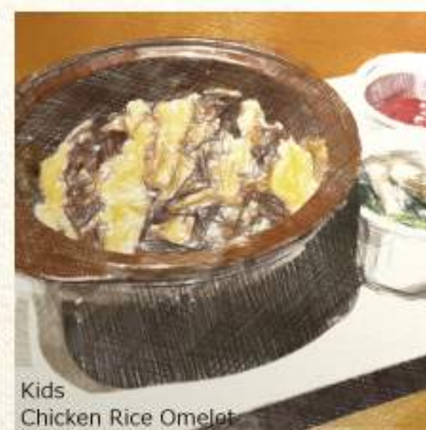
Kids Chicken Rice Omelet