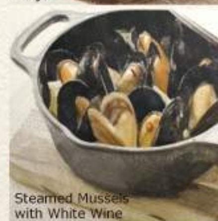
Steamed Mussels with White Wine