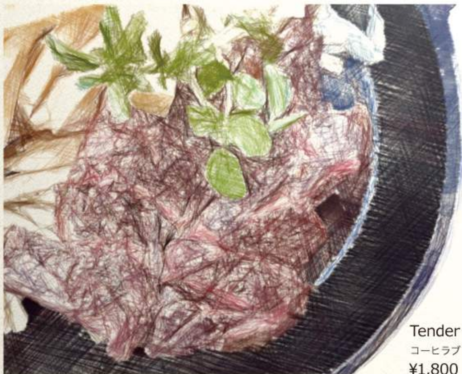
Tender Steak コーヒラブ テンダーステーキ ¥1,800