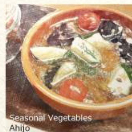
Seasonal Vegetables Ahijo

Stewing Pasta or Rice with The Leftover Soup of Steamed Mussels +¥500 ムール貝の白ワイン蒸しの残ったスープを、お pasta or おおじや に!!